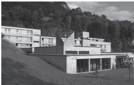
Mattli Antoniushaus, Morschach